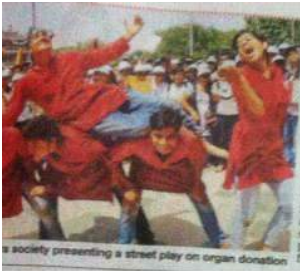
A society presenting a street play on organ donation