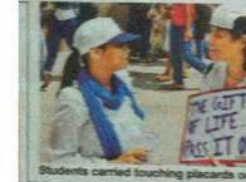
Students carried touching placards on their walk