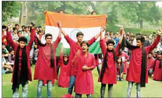
राजा गार्डन स्थित शिवाजी कॉलेज में सरदार वल्लभभाई पटेल के जन्मदिन पर आयोजित कार्यक्रम में नुक्कड़ नाटक प्रस्तुत करते छात्र-छात्राएं ।