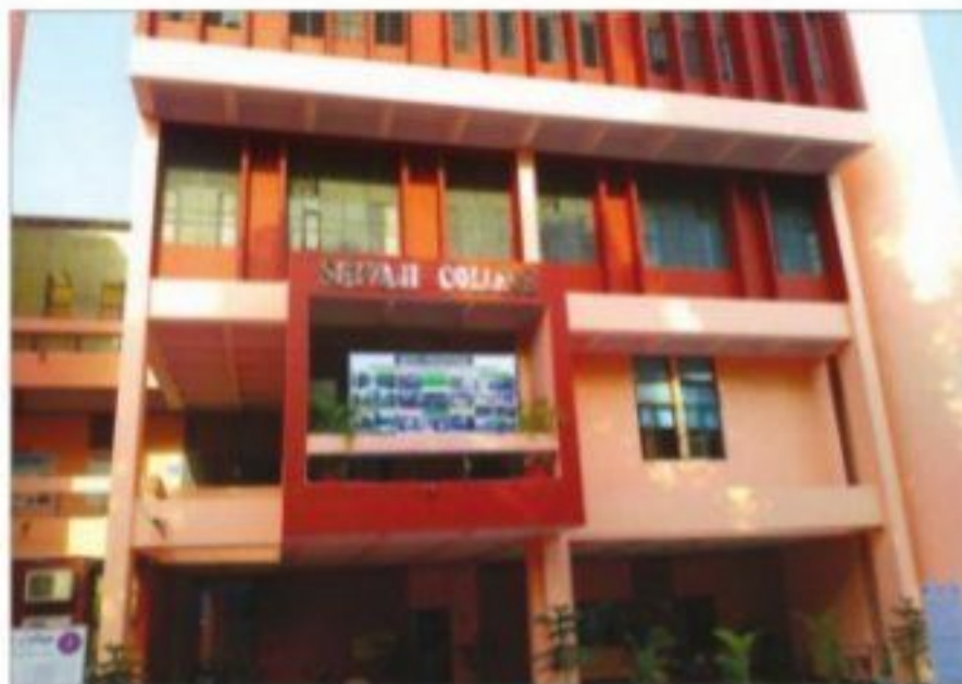
ਸ਼ਿਵਾਜੀ ਕਾਲਜ, ਨਵੀਂ ਦਿੱਲੀ ਦੀ ਇਮਾਰਤ ਦਾ ਬਾਹਰੀ ਦ੍ਰਿਸ਼।

ਦੇਸ਼ ਦੇ ਚਾਰ ਪ੍ਰਸਿੱਧ ਕਾਲਜਾਂ ਵਿਚੋਂ ਦਿੱਲੀ ਯੂਨੀਵਰਸਿਟੀ ਤੋਂ 'ਏ' ਗਰੇਡ ਸਿਰਫ ਸ਼ਿਵਾਜੀ ਕਾਲਜ ਨੂੰ ਮਿਲਿਆ। 1961 ਵਿੱਚ ਸਥਾਪਤ ਸ਼ਿਵਾਜੀ ਕਾਲਜ, ਦਿੱਲੀ ਯੂਨੀਵਰਸਿਟੀ ਦਾ ਹਿੱਸਾ ਹੈ, ਜਿੱਥੇ ਸਾਇੰਸ, ਕਾਮਰਸ ਅਤੇ ਆਰਟਸ