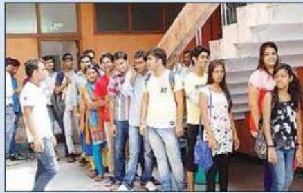
शिवाजी कॉलेज में दूर चुनाव के दौरान वोट डालने के लिए लाइन में खड़े छात्रों।