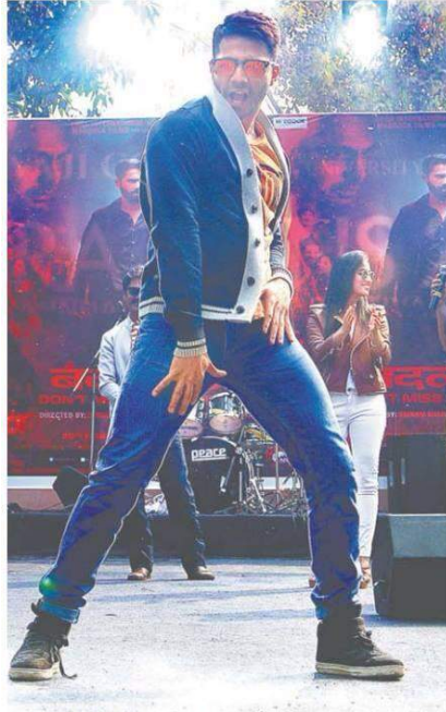
शिवाजी कॉलेज में मंगलवार को फेस्ट में पहुंचे अभिनेता वरुण धवन।

नई दिल्ली (ब्यूरो)। दिल्ली विश्वविद्यालय के कॉलेजों में वार्षिक फेस्ट का दौर शुरू हो चुका है। फेस्ट के चलते कॉलेजों में छात्रों की मस्ती जारी है। मंगलवार को शिवाजी कॉलेज के फेस्ट में छात्रों के साथ ही फिल्म अभिनेता वरुण धवन ने भी मस्ती की। वरुण कॉलेज के वार्षिक फेस्ट 'वाइब्रेशन' में पहुंचे, जहां उन्होंने छात्र-आत्राओं के संग दुमके भी लगाए। फेस्ट में देर शाम बैंड कंपटीशन का तड़का भी लगा, जिसमें विभिन्न कॉलेजों के छात्रों ने हिस्सा लिया। मंगलवार से शुरू दो दिवसीय