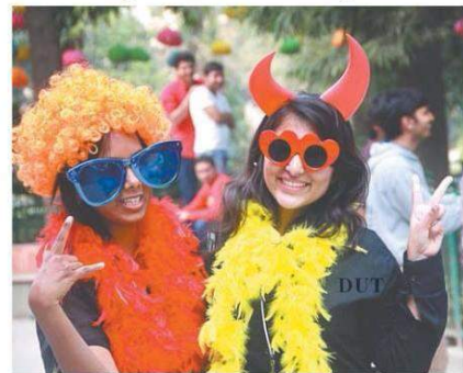
वार्षिकोत्सव 'वाइब्रेशन' में कुछ इस अंदाज में नजर आई छात्राएं।

वार्षिक फेस्ट के पहले दिन ही वरुण धवन के पहुंचने से छात्रों की मस्ती दोगुनी हो गई। वरुण ने अपने डांस से छात्रों को झूमने पर मजबूर कर दिया। फेस्ट की शुरुआत वेदास बैंड की परफॉर्मेंस से हुई। वहीं दूसरी ओर रंगोली, सोलो डांस, नेल आर्ट, फैशन शो व बैटल ऑफ बैंड्स प्रतियोगिताएं हुईं। बुधवार को अन्य प्रतियोगिताएं के साथ ही बॉलीवुड के गानों का तड़का भी लगेगा। बुधवार को क्वीन फिल्म के गाने लंदन दुमकदा की गायिका नेहा कक्कड़ अपनी आवाज से सबको मदहोश करने के लिए पहुंच रही हैं।