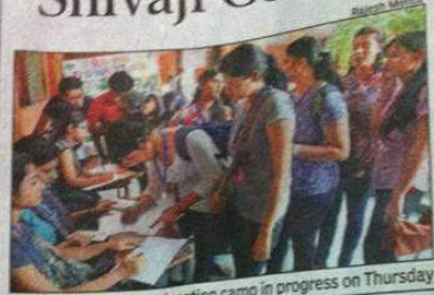
NOBLE GESTURE: A donation camp in progress on Thursday