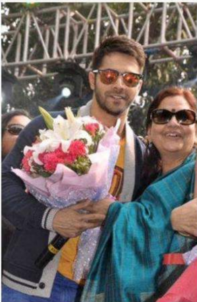
Varun Dhawan at the festival

Shivaji College successfully held its annual festival last week