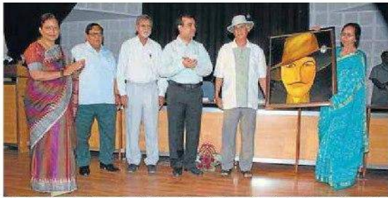
IDEOLOGY Academicians and politicians deliver lectures at Invoke-Envisioning Thoughts.