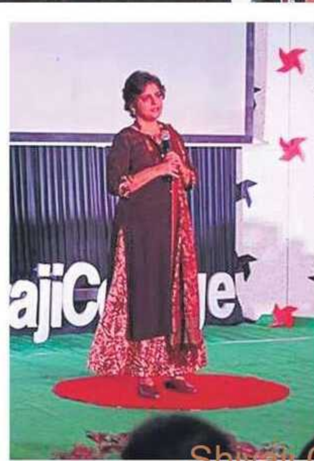
Shivaji College News