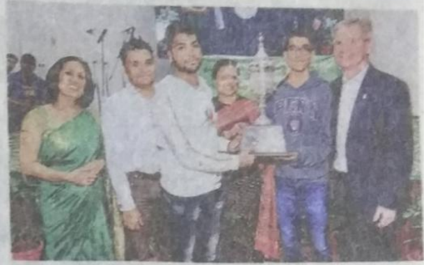
शिवाजी कॉलेज में हुई प्रतियोगिता में विजयी छात्र को सम्मानित करते कॉलेज के अध्यापक व मौजूद अन्य