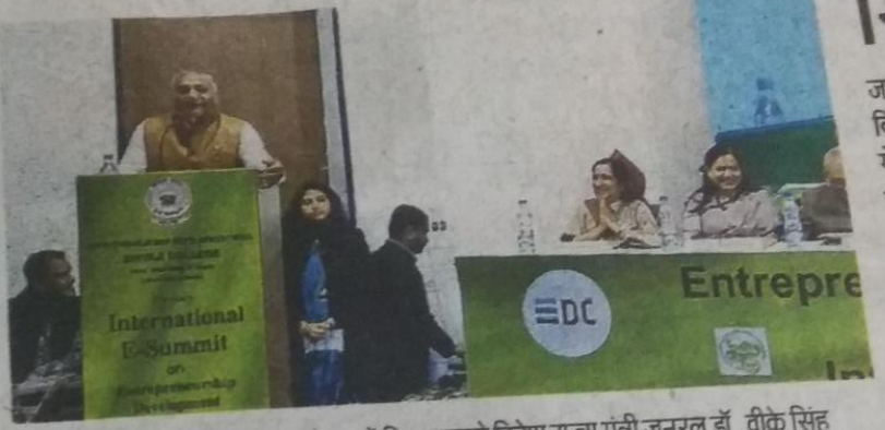
शिवाजी कॉलेज में आयोजित सम्मेलन में विचार रखते विदेश राज्य मंत्री जनरल डॉ. वीके सिंह