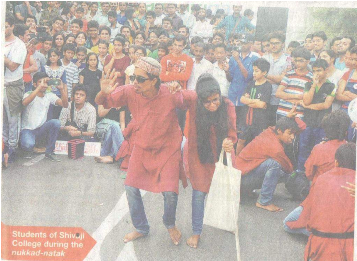
Students of Shivaji College during the nukkad-natak